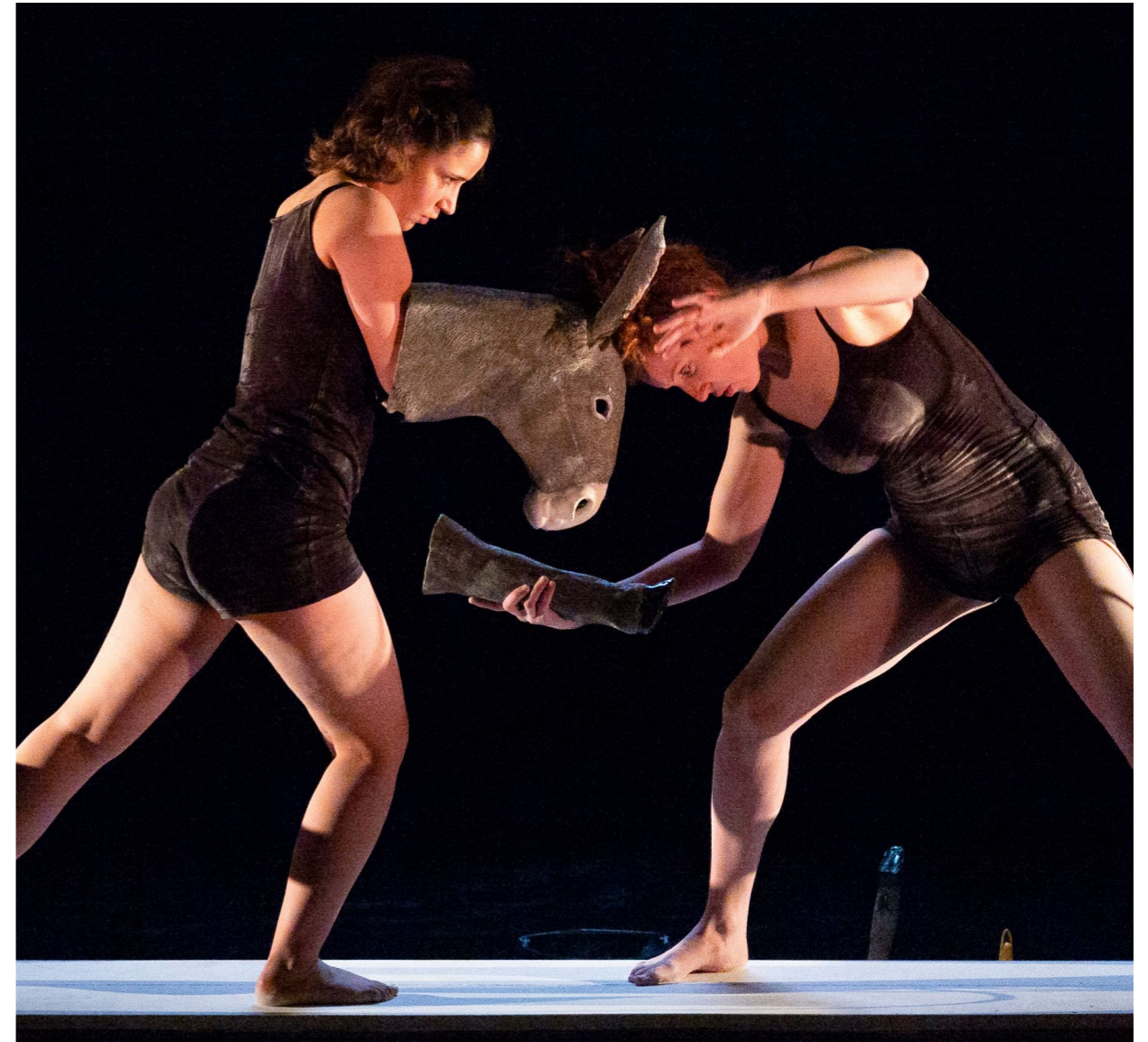
L'écho des creux