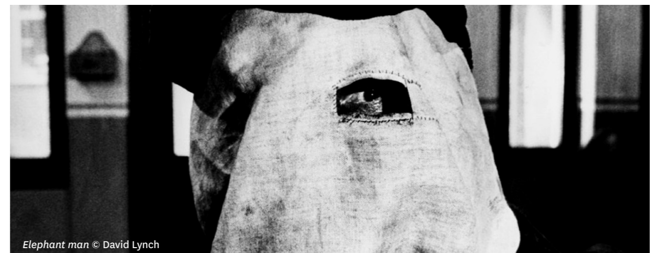
Elephant man © David Lynch

Monstres et Cie : Pete Docter-David Silverman, Lee Unkrich, 92 mn, 2001.